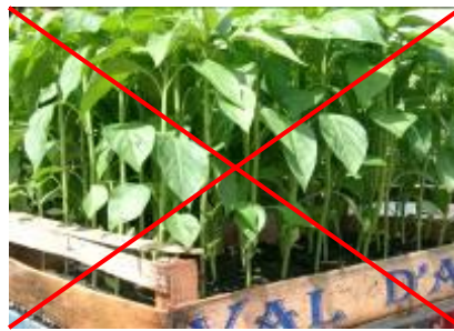
Les Plants de piment