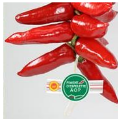
Identification de la corde