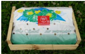
Conditionnement et Identification du Piment Entier Frais

Tous les produits qui bénéficient de l'AOP Piment d'Espelette doivent être identifiés par un système inviolable propre (une estampille) délivré par le Syndicat du Piment d'Espelette aux opérateurs habilités.