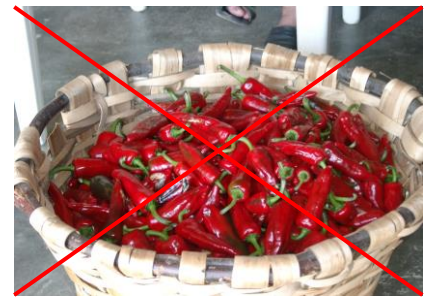
Le Piment en vrac ou le Piment à l'unité