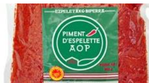
Identification de la poudre (sachet) Vente hors filière