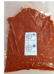
Identification de la poudre (sachet) Vente intra filière