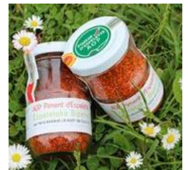
Estampille de poudre (verrine)

Les autres produits ne peuvent pas porter la dénomination « Piment d'Espelette » et notamment :