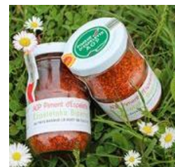
Estampille de poudre (verrine)

Les autres produits ne peuvent pas porter la dénomination « Piment d'Espelette » et notamment :