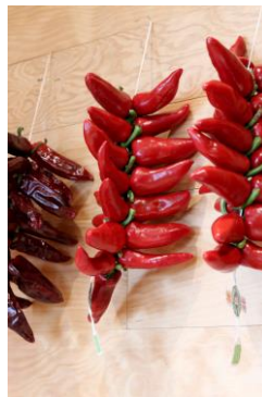
Corde de Piment d'Espelette