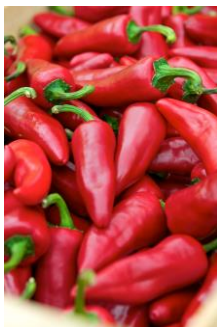
Piment d'Espelette en entier frais (conditionnement en caissette)

3 types de produits bénéficient de l'AOP