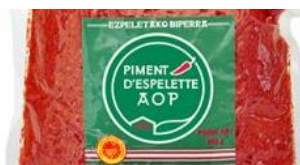
Identification de la poudre (sachet) Vente hors filière