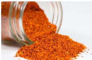
Poudre de Piment d'Espelette

Le « Piment d'Espelette » ou « Piment d'Espelette-Ezpeletako Biperra » est la seule épice reconnue :