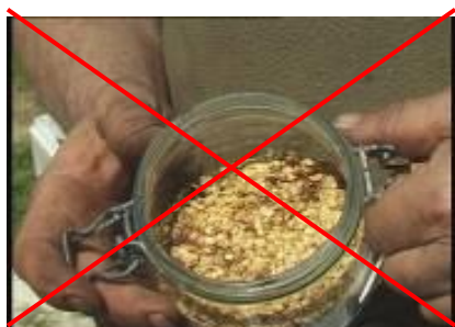
Les Graines de piment

Les autres produits ne peuvent pas porter la dénomination « Piment d'Espelette » et notamment :