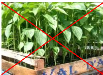
Les Plants de piment