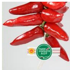
Identification de la corde