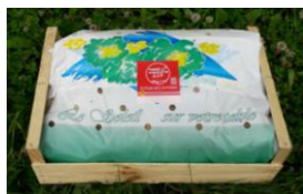
Conditionnement et Identification du Piment Entier Frais

Tous les produits qui bénéficient de l'AOP Piment d'Espelette doivent être identifiés par un système inviolable propre (une estampille) délivré par le Syndicat du Piment d'Espelette aux opérateurs habilités.