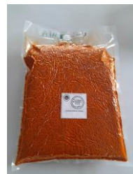
Identification de la poudre (sachet) Vente intra filière