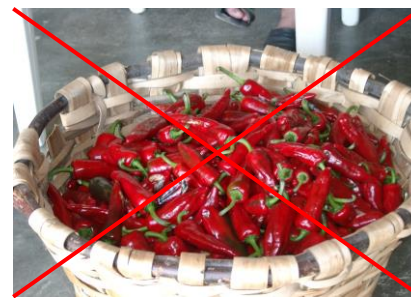
Le Piment en vrac ou piment à l'unité