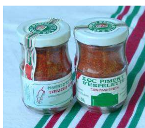
Poudre de Piment d'Espelette

Le « Piment d'Espelette » ou « Piment d'Espelette-Ezpeletako Biperra » est la seule épice re- connue :