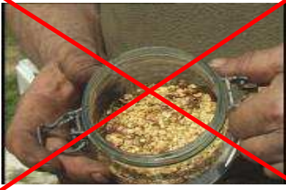
Graines de piment