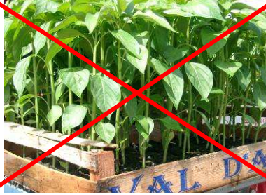
Plants de piment