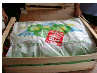
Piment d'Espelette en Entier Frais (conditionnement en cais- sette)

3 types de produits bénéficient de l'AOC