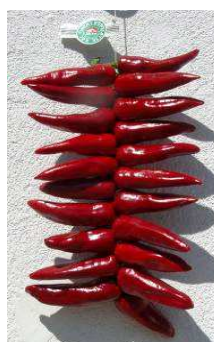
Corde de piment d'Espelette