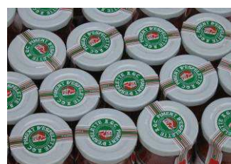
Estampille poudre (pot en verre)