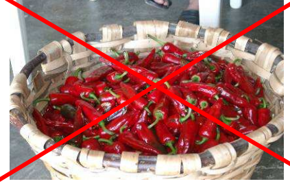
Piment en vrac ou piment à l'unité