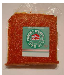
Estampille poudre (sachet)